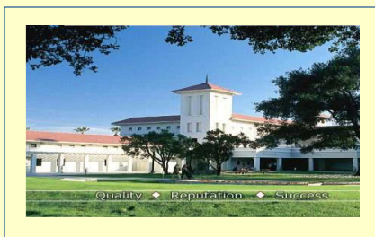
Campus Principal da ULV na Califórnia

*Sujeito a alterações de acordo com a coordenação.